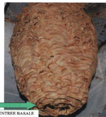
Nid secondaire – frelon européen

L'orifice de sortie est petit et situé latéralement sur le nid.