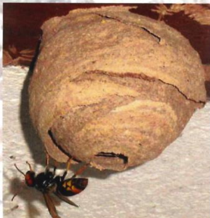
Nid primaire de frelon asiatique

Le nid primaire du frelon asiatique héberge 20 à 30 insectes. Il est généralement construit dans un endroit abrité à hauteur d'homme (ruche vide, cabanon, trou de mur, bord de toit, roncier...).