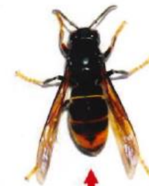
Frelon asiatique (taille réelle 3 cm)