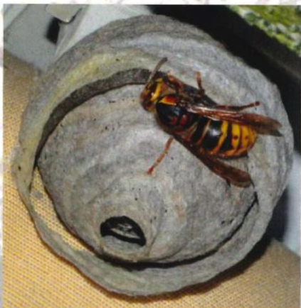
Nid primaire de frelon européen

L'orifice de sortie est situé à la base.